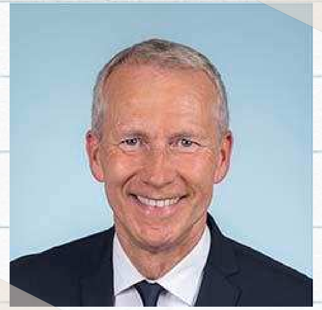
Guillaume GAROT Député de la Mayenne Rapporteur