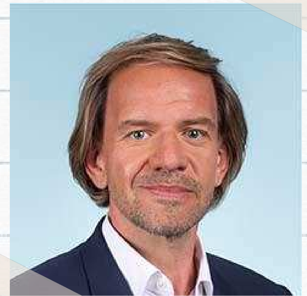
Thierry SOTHER Député du Bas-Rhin Rapporteur

En France, la réussite des Jeux Olympiques et Paralympiques de Paris 2024 a créé un véritable engouement populaire autour du sport comme le montre l'augmentation du nombre de licenciés communiquée par plusieurs fédérations.