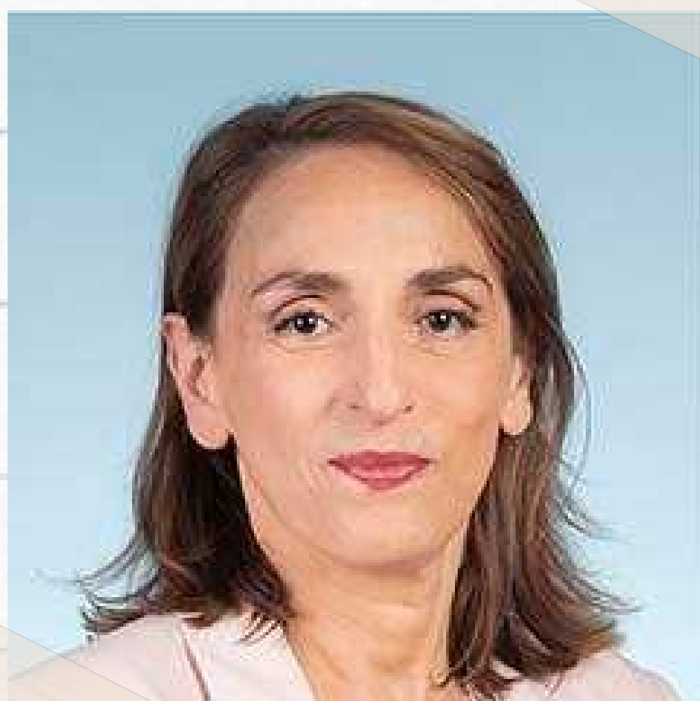
Fatiha KELOUA HACHI

Députée de Seine-Saint-Denis Rapporteure